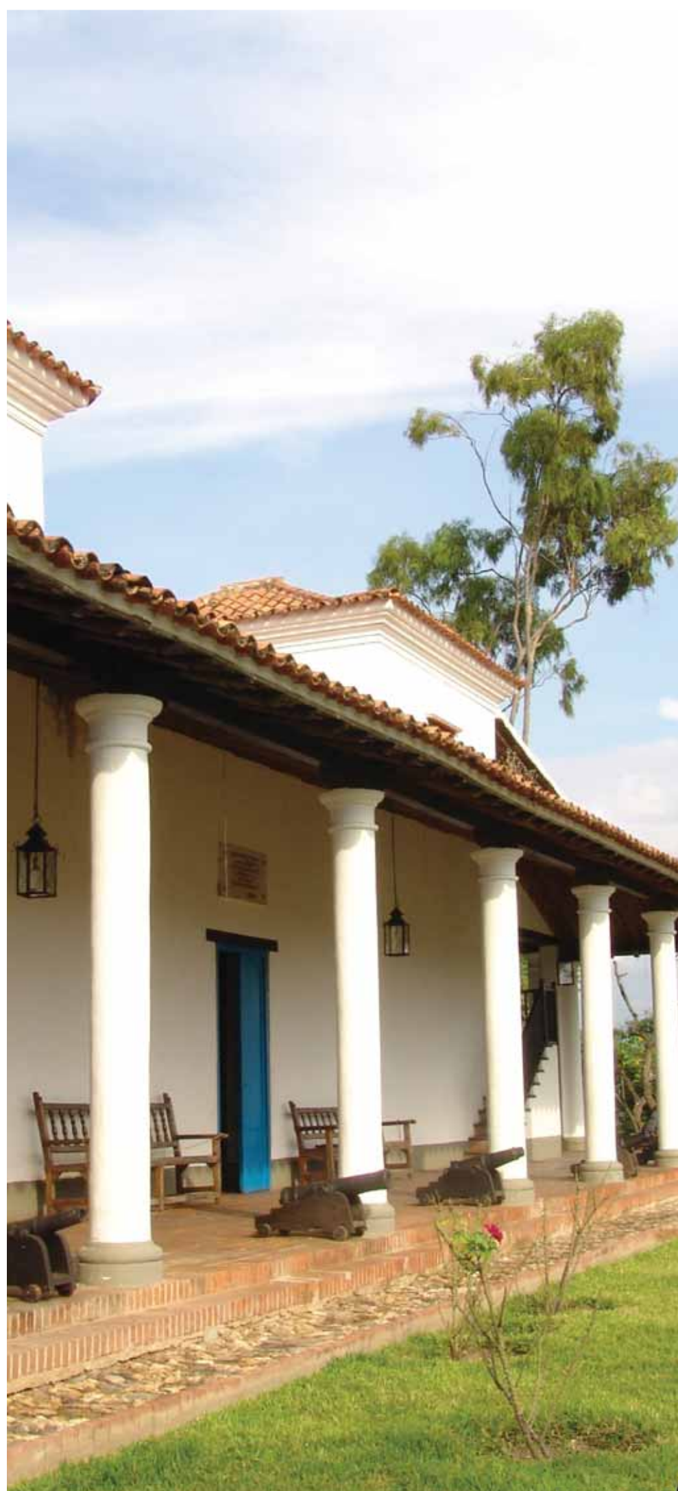
Hacienda San Mateo.

El héroe de La Victoria, Vicente Campo Elías, murió el 17 de marzo a causa de las heridas que sufrió en las acciones del cerro El Calvario.