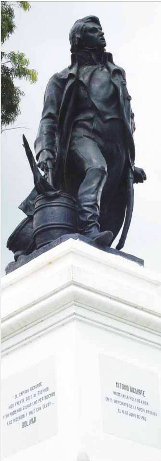
Escultura de Antonio Ricaurte realizada por Lorenzo González el 2 de julio de 1911

su parte, Boves aumentaba la presión sobre los patriotas con nuevas fuerzas de infantería y caballería en un intento por destruir a Bolívar y sus soldados. Ataques y contraataques se llevaban a cabo con numerosas pérdidas para ambos ejércitos, hasta que los patriotas empiezan a caer derrotados tras la muerte del aguerrido Villapol y otros oficiales. Cuando ya parecía que los patriotas estaban vencidos, llegaron oportunos refuerzos para contrarrestar la acción de los realistas. Y a las cinco de la tarde, cuando todavía se sostenía el combate, Boves, que se encontraba a la cabeza del ataque, cae herido, y por ello sus tropas se retiran de San Mateo hacia la población de Villa de Cura.