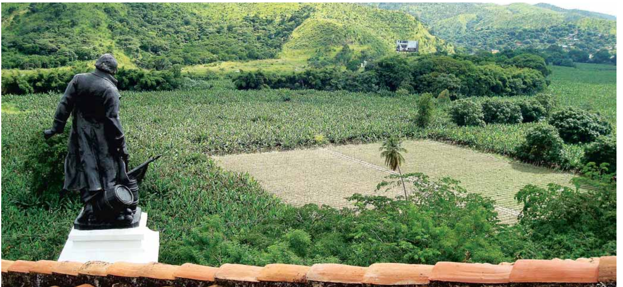
Hacienda San Mateo.