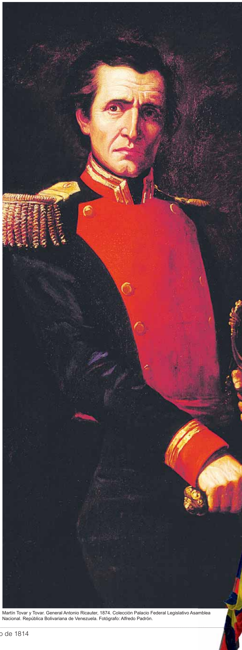
Martín Tovar y Tovar. General Antonio Ricaurte, 1874. Colección Palacio Federal Legislativo Asamblea Nacional. República Bolivariana de Venezuela.