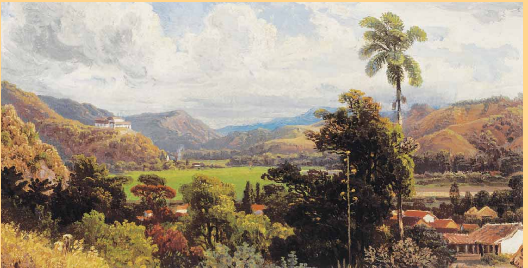
Ferdinand Bellermann, La casa de la familia Bolívar en San Mateo, 1844. Colección Galería de Arte Nacional.