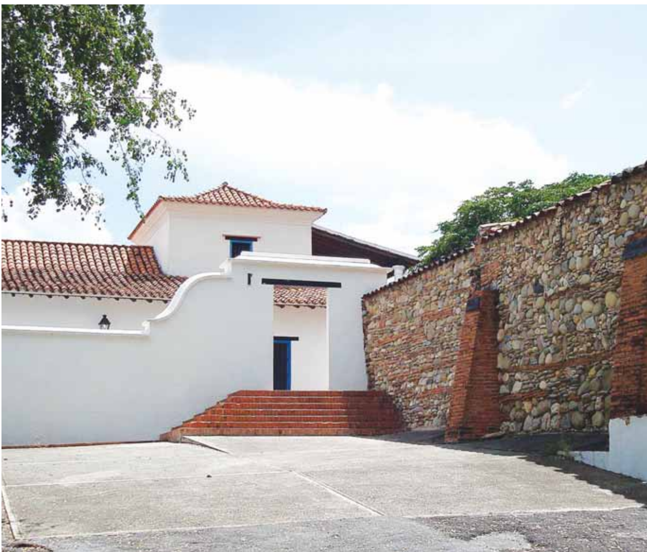
Hacienda San Mateo.

En plena lucha armada, San Mateo sería sitiada por Morales y el sanguinario Boves y su horda infernal. Para evitar que la pólvora y el armamento que se encontraba en la hacienda fuesen a caer en manos del ejército realista, el joven Antonio Ricaurte, sin más opciones, decidió el 25 de marzo de 1814 volar el parque armado, inmolándose en nombre del ideal emancipador, salvando así al Ejército Libertador y evitando que Morales y Boves se apoderaran de los pertrechos patriotas. Ese mismo año la hacienda es confiscada y queda en manos de los realistas.