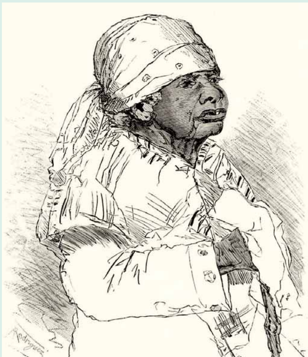
Ilustración de Alberto Urdaneta