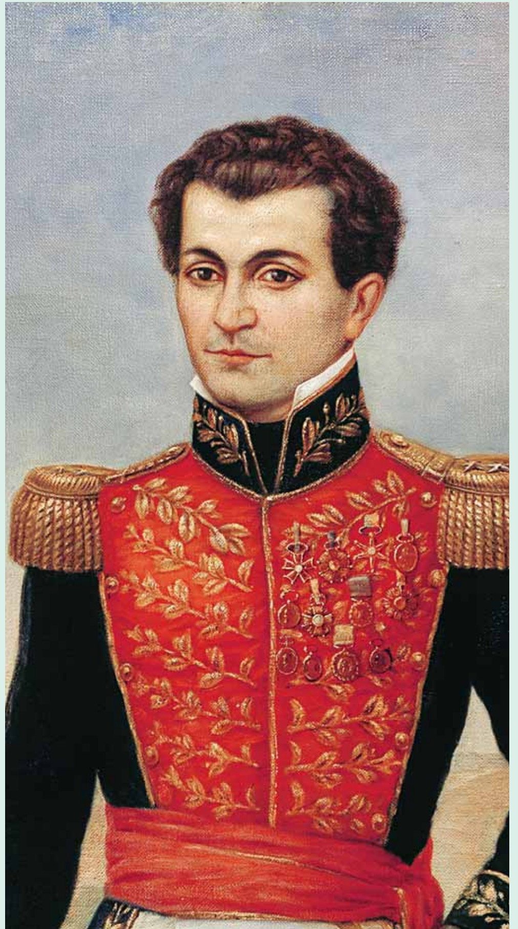
José Eugenio Montoya, General José Trinidad Morán, 1922. Colección Palacio Federal Legislativo Asamblea Nacional. República Bolivariana de Venezuela.