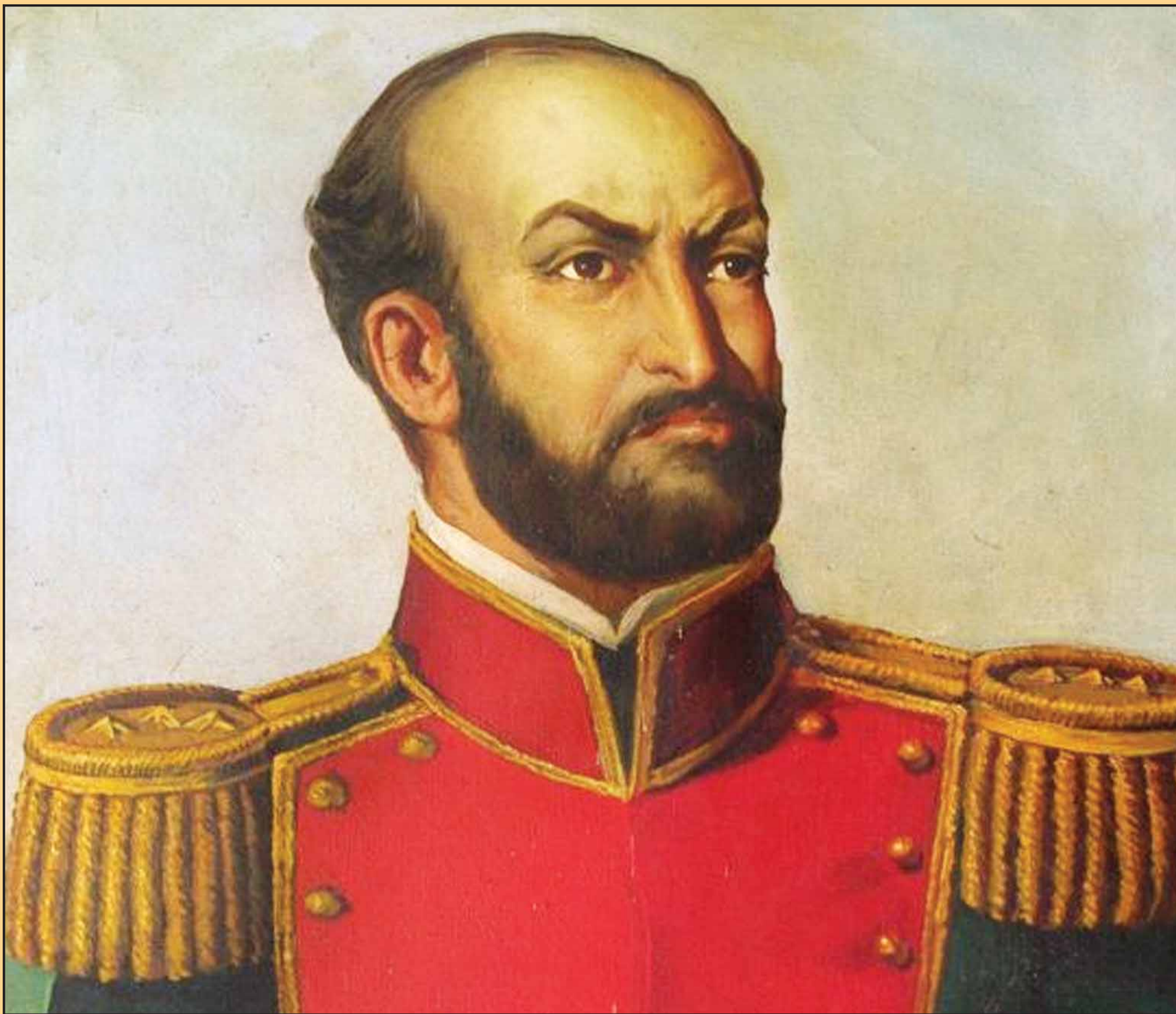
Autor Desconocido. José Tomás Boves.