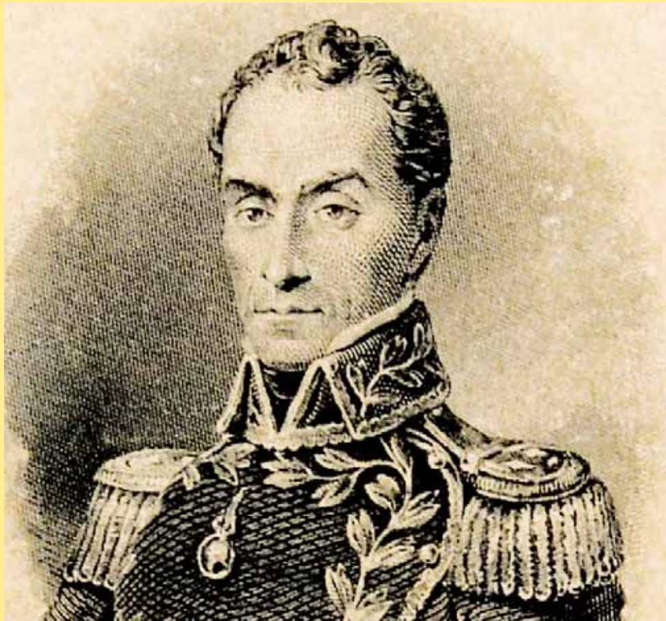
Autor desconocido. Al Libertador Simón Bolívar en su Centenario. 1883. Colección Museo Bolivariano.