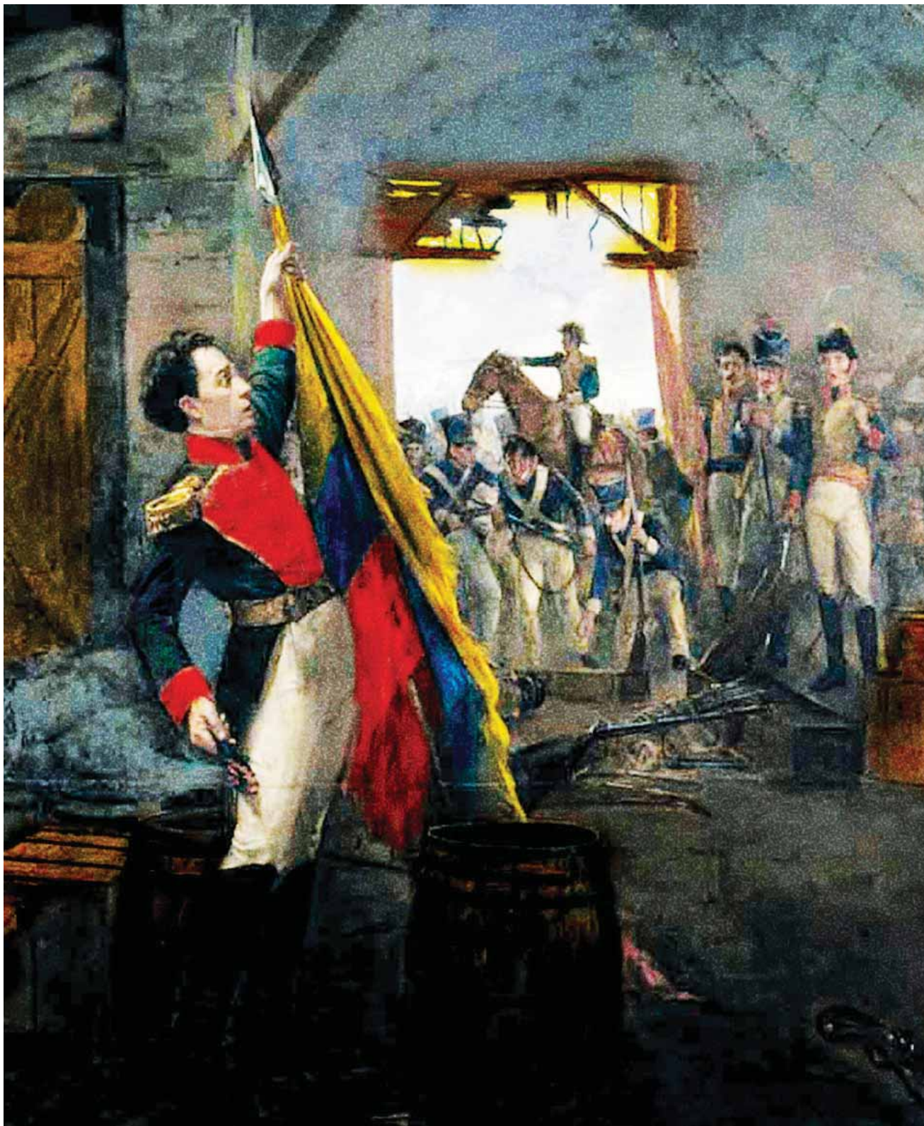
Pedro Alcántara Quijano, Ricaurte en San Mateo, 1920, Museo Nacional de Colombia.

Antonio Ricaurte es el prócer granadino que selló con su vida la victoria republicana contra las tropas realistas en San Mateo, el 25 de marzo de 1814. Determinante personaje que, con una firme visión liberal y fiel creyente de la causa independentista, participó en la liberación de Nueva Granada del yugo español y, poco tiempo después, abrigó la iniciativa de Simón Bolívar de realizar una expedición libertadora hacia Caracas, con miras al nacimiento de una nueva República.