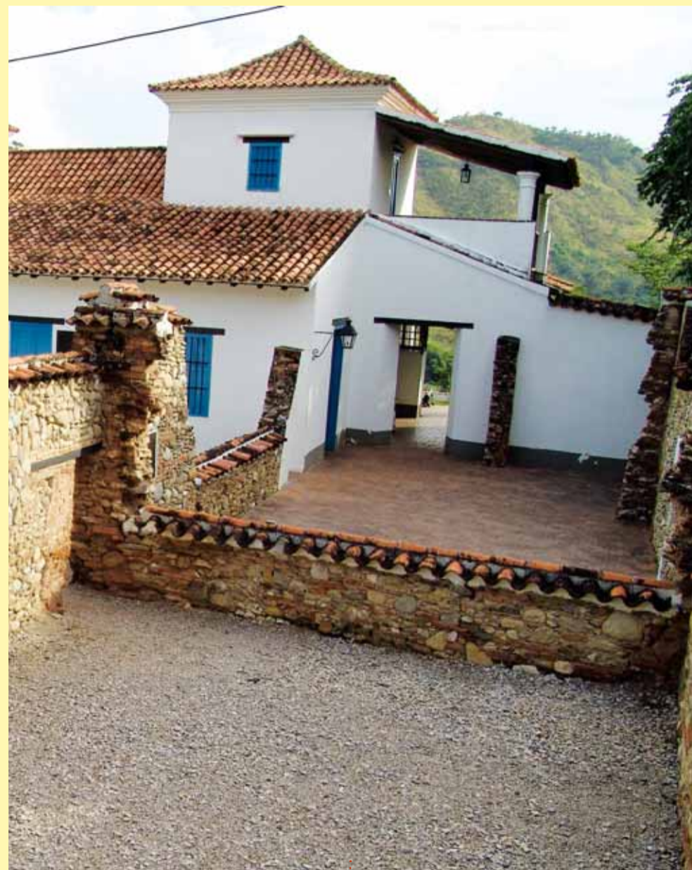
Hacienda San Mateo.

Cine-Foro. Zamora, tierra y hombres libres. Director Román Chalbaud, Amazonia Films.